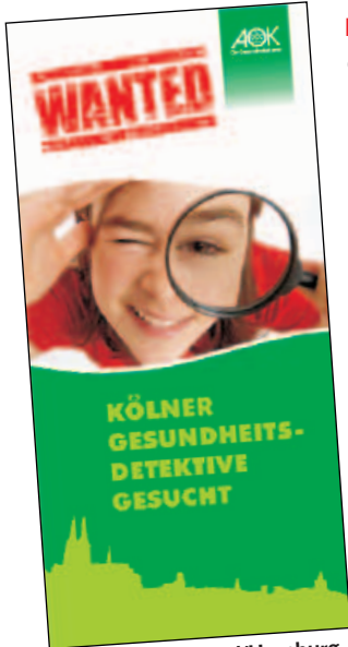
Die AOK Rheinland/Hamburg belohnt Engagement

IN DIESEM JAHR hat sich die AOK Rheinland/Hamburg etwas Besonderes ausgedacht: Die AOK sucht die Kölner Gesundheitsdetektive! Wer ist das? Das sind Kinder, die sich um die Gesundheit anderer Kinder in Familien, Kindergärten, Schulen, Freizeiteinrichtungen, Vereinen und anderen Institutionen kümmern – die AOK sucht Euch!