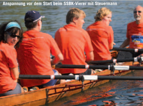
Anspannung vor dem Start beim SSBK-Vierer mit Steuermann