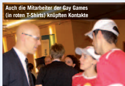
Auch die Mitarbeiter der Gay Games (in roten T-Shirts) knüpften Kontakte

Auch dieses Jahr war der Sport mit neun Vereinen/Institutionen an „guten Geschäften“ beteiligt. Es durfte über alles gesprochen werden, nur nicht über Geld. Sachspenden, Mitarbeiterinsatz, Veranstaltungen und Know-how sind die vier Säulen des Marktplatzes. Gefragt: Kreativität und gute