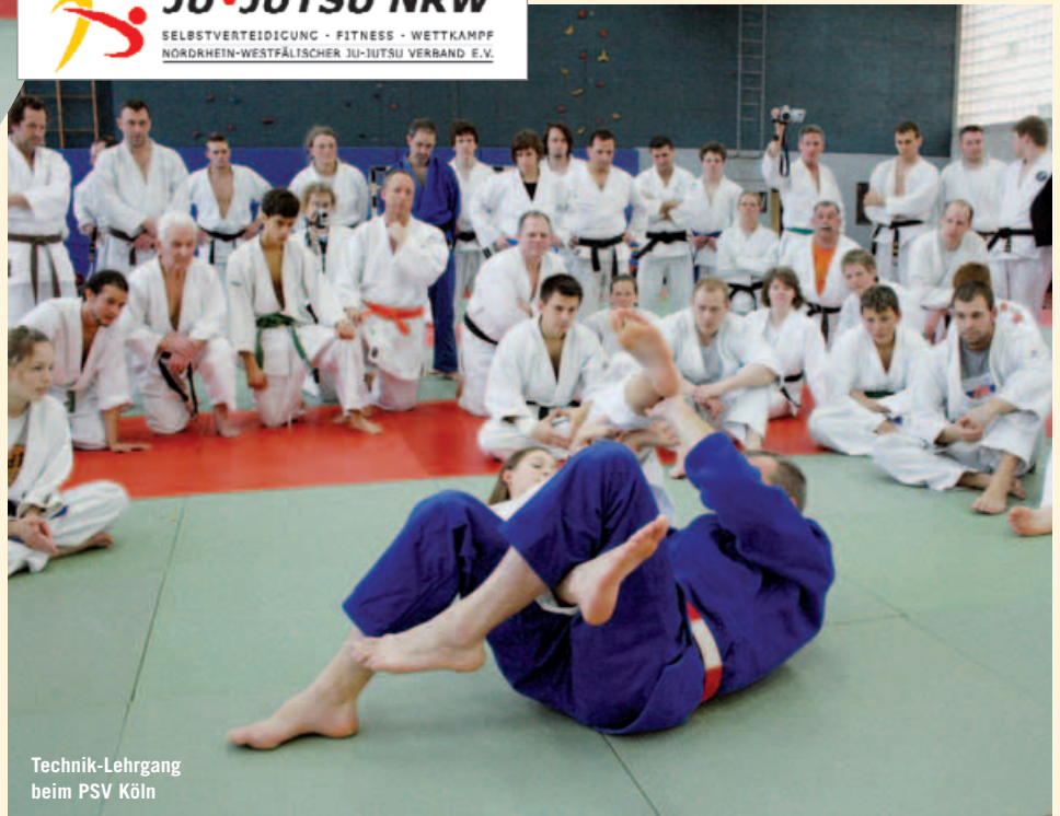
Technik-Lehrgang beim PSV Köln

Ju-Jutsu ist eine Sportart mit vielseitigen körperlichen und geistigen Anforderungen und fördert die harmonische Ent-