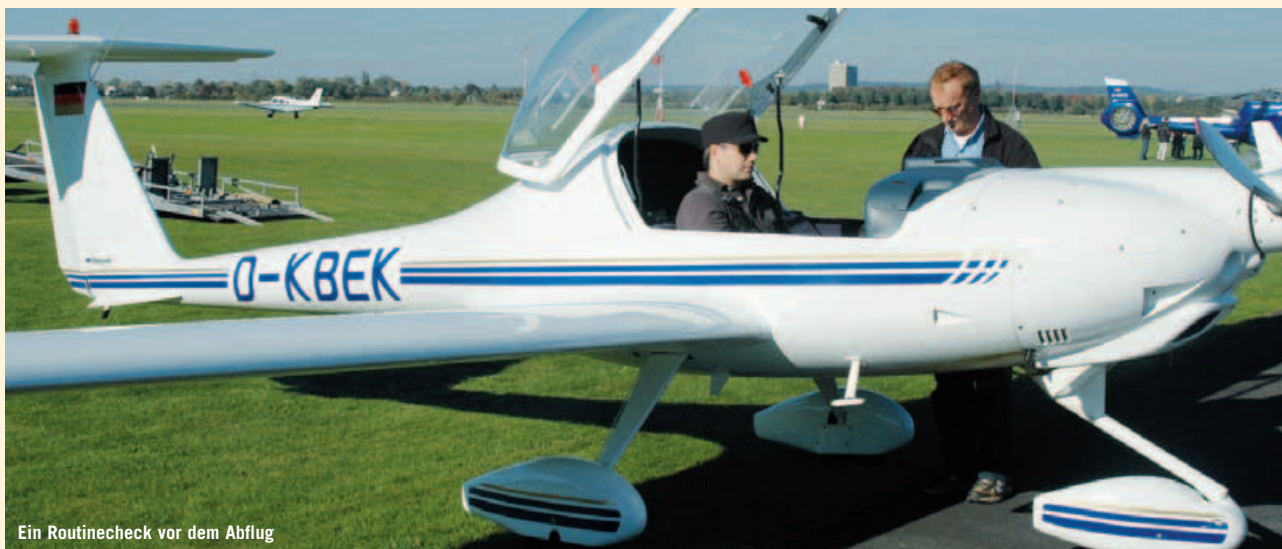
Ein Routinecheck vor dem Abflug

Der Deutsche Aero-Club Landesverband Nordrhein Westfalen e.V. (DAeC LV NRW) vertritt als Luftsportverband die Interessen der in Nordrhein Westfalen ansässigen Luftsportvereine. Er verbindet in seiner Organisation Motorflieger, Segelflieger, Motorsegelflieger, Modellflieger, Ballonfahrer, Fallschirmspringer, Ultraleichtflieger und Drachenflieger, die sich in rund 240 Vereinen zusammengeschlossen haben.