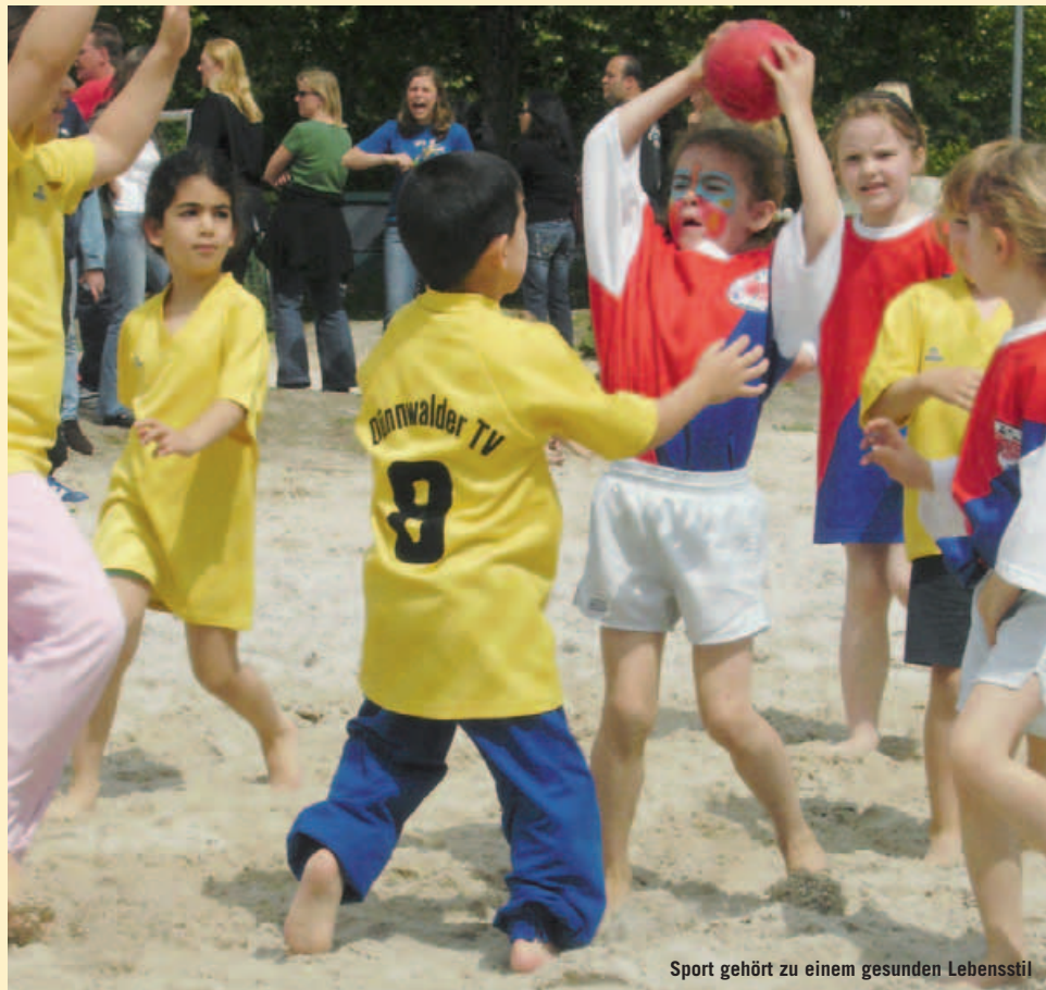
Sport gehört zu einem gesunden Lebensstil

Mit der Ausschreibung des Förderpreises „Starke Kids Netzwerk“ will die AOK Rheinland/Hamburg stärker auf das Thema Kinder- und Jugendgesundheit in der Öffentlichkeit aufmerksam machen. Ausgezeichnet werden sollen Projekte in allen Regionen des Rheinlandes aus den Bereichen gesunde Ernährung, Bewegung, Stressbewältigung, Suchtmittelvermeidung oder ein Mix dieser Bereiche. Bewerben können sich u. a. Sportvereine, die Projekte in der Kinder- und Jugendgesundheit durchführen. Die ausgezeichneten Projekte erhalten einen Förderpreis von bis zu 3.000 Euro. Anmeldeschluss ist der 9. Mai 2008. Informationen sind in jeder Geschäftsstelle der AOK Rheinland/Hamburg oder im Internet unter www.aok.de/rh zu erhalten. Ziel der Initiative ist es, bei Kindern und Jugendlichen Gesundheitsrisiken zu minimieren. Die gesundheitliche Situation von Kindern und Jugendlichen hat sich in den letzten Jahren deutlich verschlechtert. Über 15 % der Jugendlichen sind übergewichtig, 6 % sind sogar stark übergewichtig. Etwa