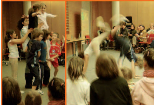
Akrobatik und Breakdance faszinierten die Tagungsteilnehmer

Kölner Grundschul-kinder begeisterten mit Akrobatik, Jazz-tanz und Breakdance