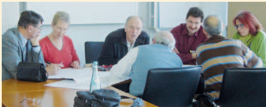
Intensive Diskussionen brachten interessante Ergebnisse

Der „Sport der Älteren“ ist inzwischen als einer der größten Wachstumsfaktoren im Sport anerkannt. Bewegung und Sport sind unumstrittene Faktoren der Gesundheitsprävention, besonders im Alter. In Kooperation mit dem LandesSportBund NRW führte der StadtSportBund Köln, gemeinsam mit den Kölner Sportvereinen und Fachschaften, die Zukunftswerkstatt durch, um dem Seniorensport in Köln neue Impulse zu geben.