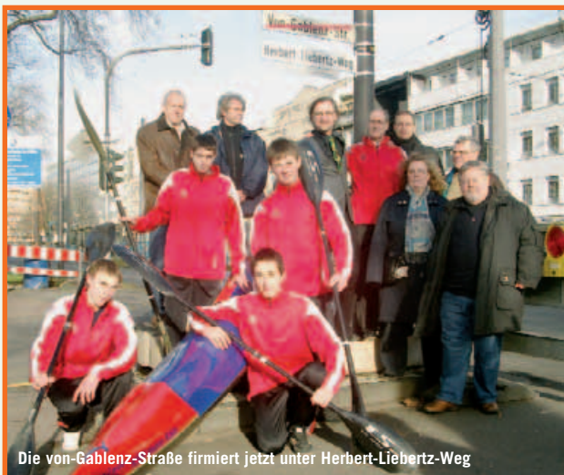
Die von-Gablenz-Straße firmiert jetzt unter Herbert-Liebertz-Weg

Die Stadt Köln hat zu Ehren des Ehrenamts im Sport im Allge-meinen und im Besonderen das Lebenswerk von Herbert Liebertz und seinen Einsatz für den Wildwasser-Rennsport durch die Wid-