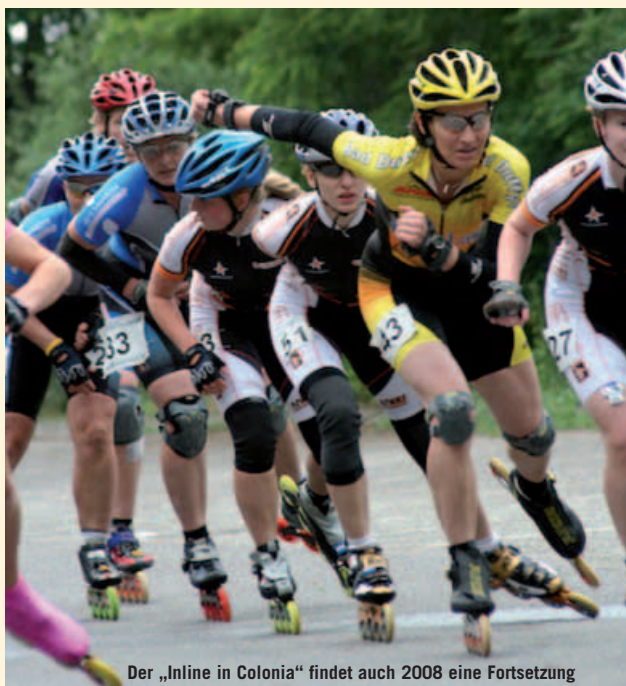
Der „Inline in Colonia“ findet auch 2008 eine Fortsetzung

Doch auch die Vereine sind sehr engagiert und führen Veranstaltungen durch, die die Sportstadt Köln weit über die Grenzen hinaus bekannt machen. So wurde vom SSC Kölner Roll-Möpsen in