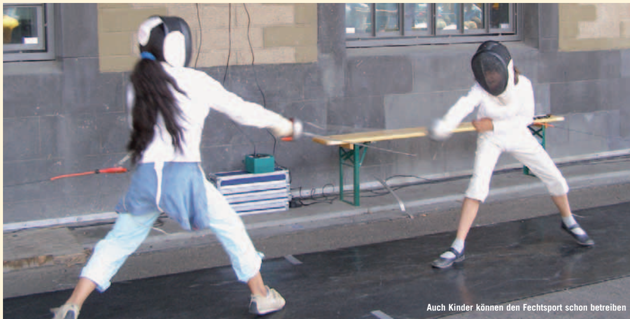
Auch Kinder können den Fechtsport schon betreiben

Der Fechtsport stellt vielfältige Anforderungen an die Aktiven