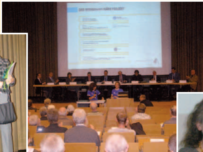
Blick in den Hörsaal 1 der Deutschen Sporthochschule