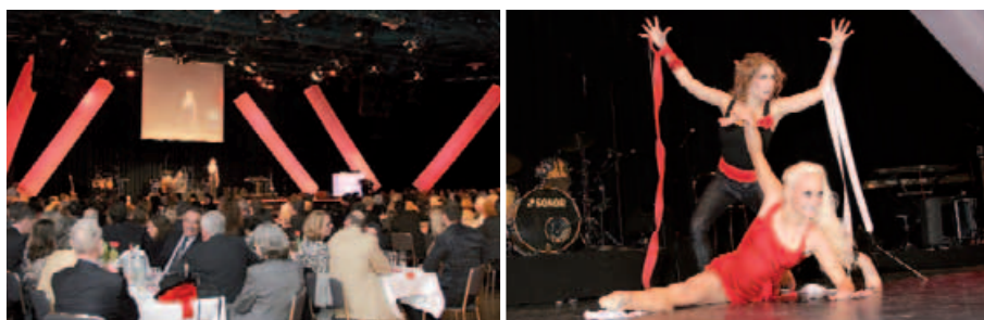
Impressionen von der „Kölschen Sportnaach 2008“

Die zweite Auflage der Veranstaltung steigt am 7. März des kommenden Jahres