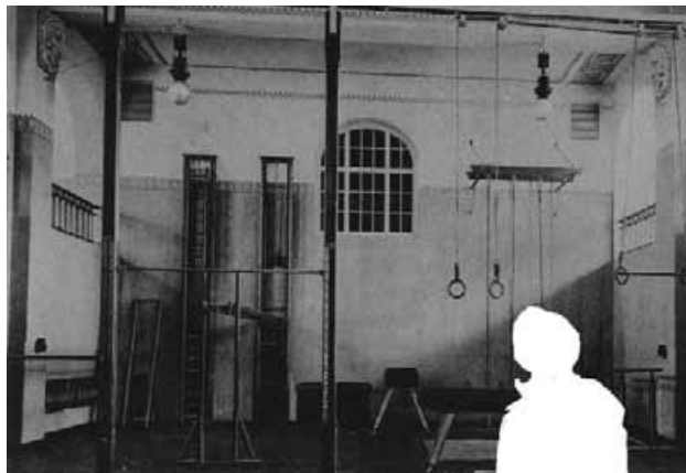
Turnhalle der Kölner Handelshochschule, um 1900. Historische Sportstätten können als 3D-simulierte Räume im Virtuellen Museum gezeigt werden

Auf der Suche nach einer angemessenen und innovativen Form des Umgangs mit Geschichte bietet ein „Virtuelles Museum“ aber äußerst attraktive Möglichkeiten. Die außergewöhnliche Sicht auf die Sportgeschichte einer Stadt schafft eine Präsentationsplattform, bei der eine Verbindung zwischen historischen Fakten, visueller Kommunikation und emotionalem Erleben hergestellt wird. Sie bietet zudem die Chance auf aktuelle Entwicklungen unmittelbar zu reagieren. Der Begriff des „Museums“ wurde dabei ganz bewusst gewählt, da er die Bedeutung des Sports für die Alltagsgeschichte unterstreicht und