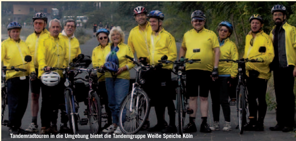
Tandemradtouren in die Umgebung bietet die Tandemgruppe Weiße Speiche Köln

Der organisierte Sport in Köln hat besonders in der letzten Zeit gezeigt, dass er politikfähig ist. Die Politik misst dem Sport wieder mehr Bedeutung zu und wertet damit insbesondere das Ehrenamt auf.