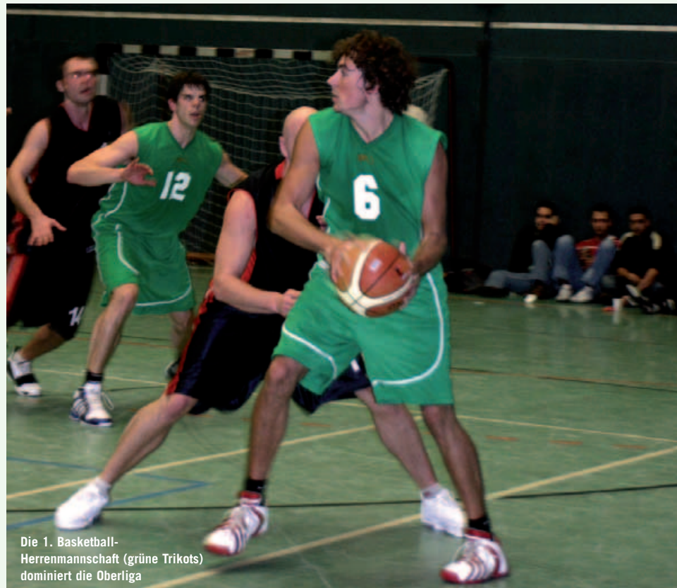
Die 1. Basketball-Herrenmannschaft (grüne Trikots) dominiert die Oberliga