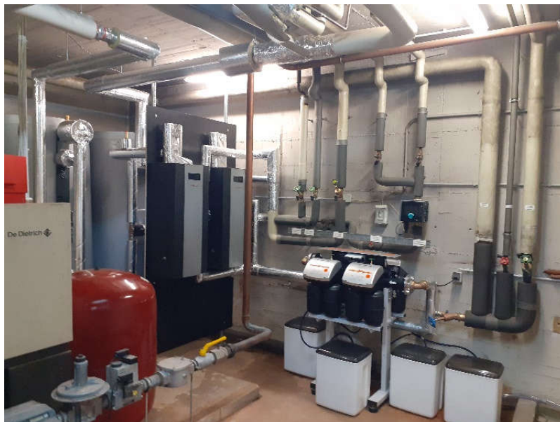
Gesamtübersicht auf die neue komplette Anlage, die für den Solaranschluss vorbereitet ist.