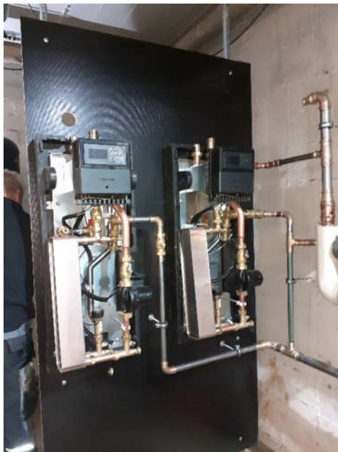
Die neue Steuerung der Warmwasseraufbereitung in der Montageendphase