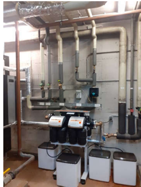
Die neue Wasserenthärtungsanlage mit Regenerierbehälter und Anschlüssen an das Rohrsystem.