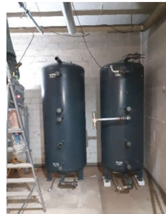
Links: Kalkmenge aus dem alten Kessel Oben: Freie Fläche für neue WW-Anlage Rechts: Die neuen Speicher mit je 500 Liter