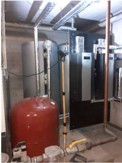
Blicke auf die neue Anlage der Warmwasseraufbereitung mit Ausgleichsbehälter im Vordergrund und Pufferspeicher hinten.